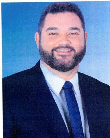
André Miguel Ribeiro dos Santos Prefeito Municipal